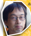
糸崎公朗 / 写真家・フォトモ作家

※本牧を写した写真(プリントアウトやコピーでも可)、切るもの(ハサミ、カッターなど)、貼るもの(のり、両面テープなど)、フォトモの台紙(ボール紙、段ボール、お菓子の空き箱など)を持参のうえご参加ください。