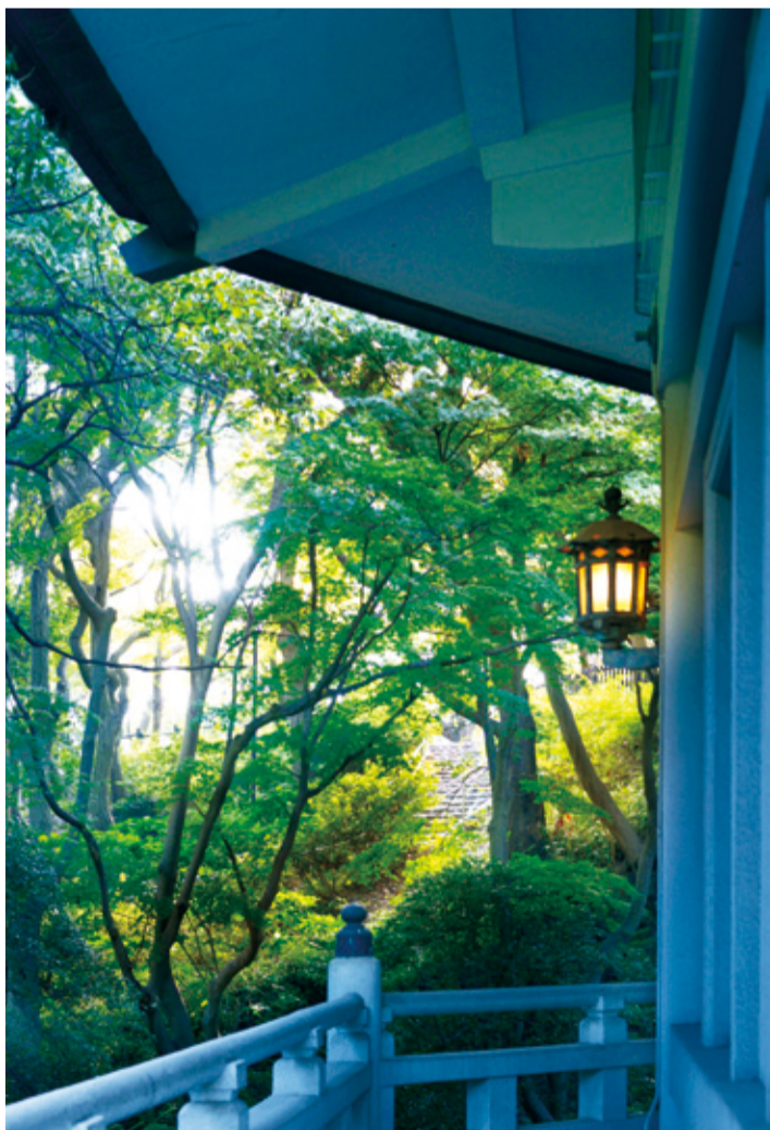
八聖殿郷土資料館