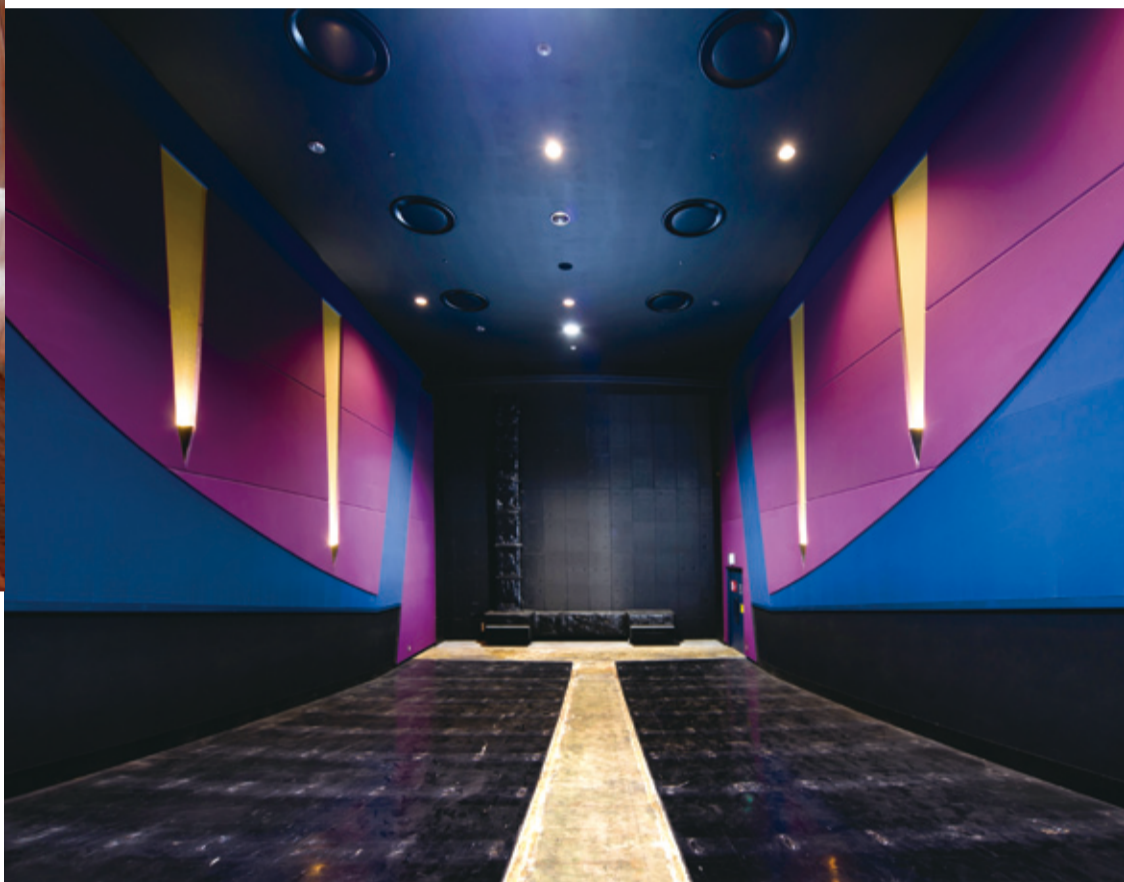
かつての映画館、HONMOKU AREA-2の館内

◎ 12月12日 [土] 17:30 - 12月13日 [日] 13:00 - 📍 HONMOKU AREA-2