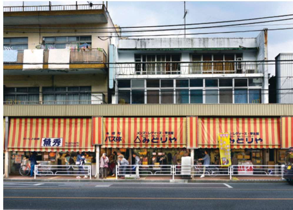
本牧通り、本郷町商店街

本 牧の知られざる世界へようこそ。『ギブ・ミー・チョコレート!』は、この町を「異世界」として巡っていくツアー型作品。戦後の流行語を冠したこのタイトルは、米軍のベースキャンプがあった、かつての本牧の記憶を呼び覚ますものにもなるだろう。参加者はみずからの足で、町の各所に眠る「秘密の場所」を巡って