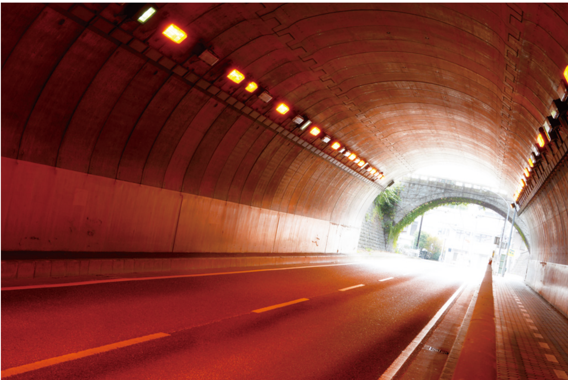
本牧の入口・麦田トンネル(山手隧道)