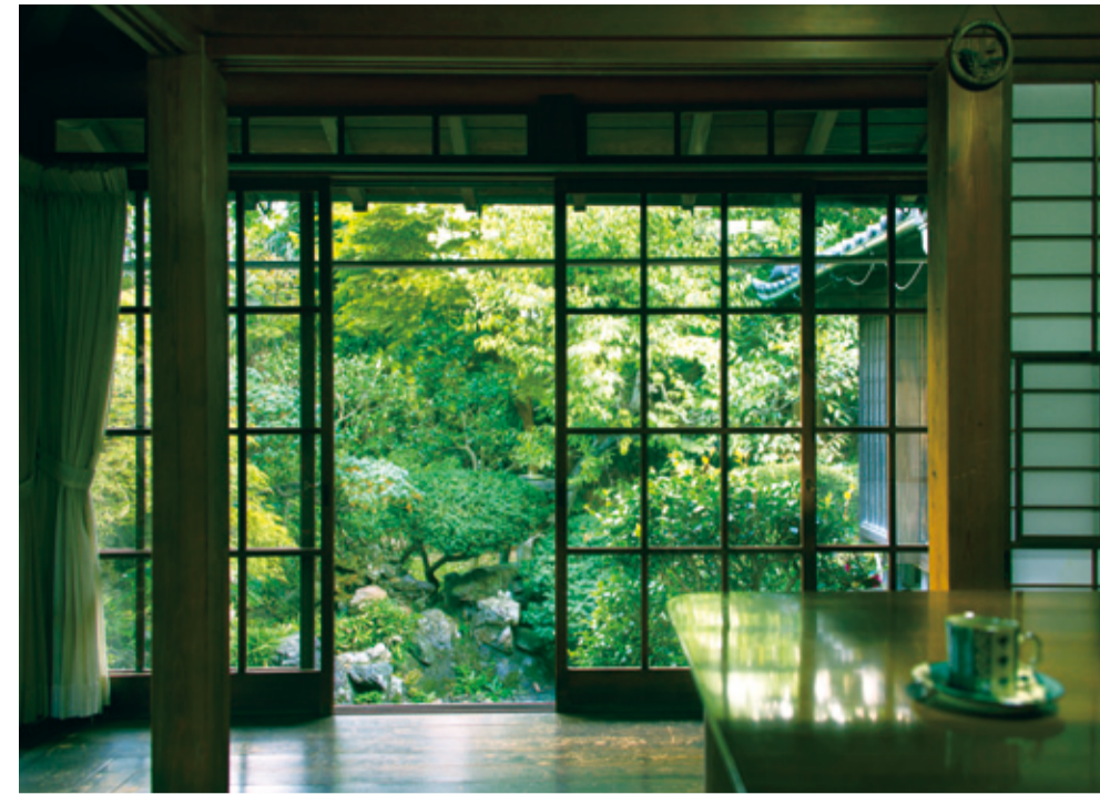
豆松カフェの店内

本牧通りを根岸方面へ向かうと、間門エリア。築80年の古民家・豆松カフェの門が、裏路地にひっそり佇んでいる。明治時代の実業家・原三溪によってつくられた広大な日本庭園、三溪園も近い。その先はもう、海だった。