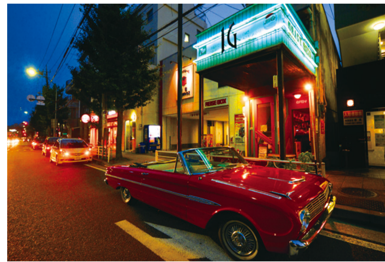
本牧の象徴的存在のひとつ、IG